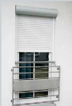
HOCOchange s předsazenou roletou – Exkluziv