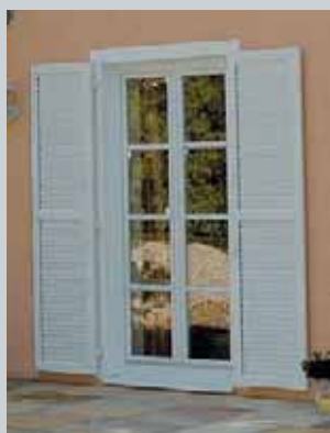
Príčky v různorodém provedení a okenice jsou vám k dispozici.