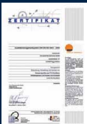
Certifikováno a přezkušováno na sobě nezávislými institucemi.